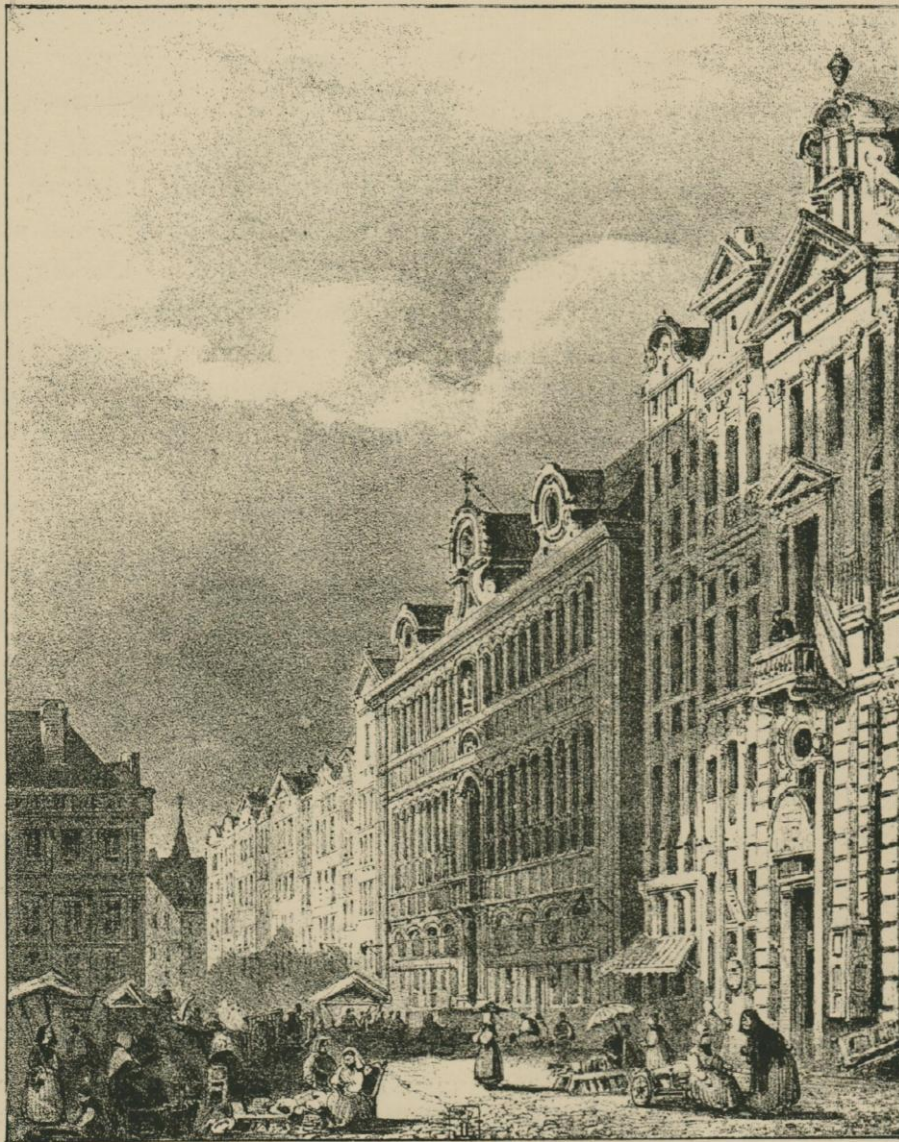
LA MAISON DU ROI EN 1845.

ont l'air humble des choses démodées. Leur mine parcheminée et crevassée jure avec les façons nouvelles dont on y vit, avec les mœurs rénovées et l'allure toujours rajeunie et modifiée des êtres qui y passent. On les visite avec curiosité, mais